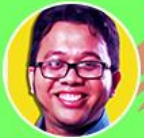
BENDRI JAISYURRAHMAN @ajobendri