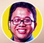
BENDRI JAISYURRAHMAN @ajobendri